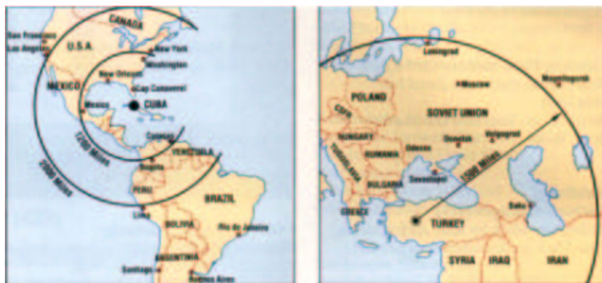
Abb. 1: Graphik links - Reichweite der sowjetischen Raketen auf Kuba; rechts - Reichweite der US-Raketen in der Türkei

In der Kubakrise hatten beide Großmächte erkannt, dass es sinnvoll war zu Regelungen zu kommen, die militärische Lage von unkalkulierbaren Risiken zu befreien und die gegenseitige Vernichtung zu verhindern. Nach der Demontage der sowjetischen Raketenstellungen auf Kuba, der bald der Abzug amerikanischer Raketen aus der Türkei folgte, wurde als erster Schritt eine hot line , eine ständige Telefonverbindung, zwischen dem Kreml und dem Weißen Haus eingerichtet. 1963 einigten sich die USA mit Großbritannien und der UdSSR auf einen Stopp von oberirdischen Kernwaffentests (China und Frankreich entwickelten damals gerade eigene Kernwaffen und traten nicht bei). 1968 einigten man sich auf den Kernwaffensperrvertrag , der, um die Zahl der Atomwaffenmächte möglichst klein zu halten, die Nichtweitergabe (Non-Proliferation) von kernwaffenfähigem Material vereinbarte. Dessen ungeachtet sind außer den genannten Staaten heute mindestens Israel, Indien und Pakistan weitere Besitzer von Kernwaffen.